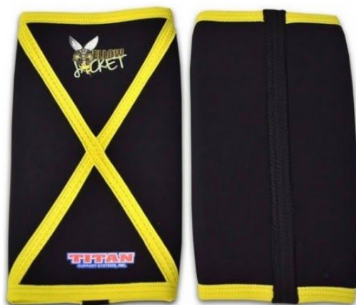
Figura 2. Rodilleras con costura en forma de X. No permitidas en la modalidad Raw Nota: se permiten las rodilleras tipo Titan The Yellow Jacket, pero solo para las divisiones classic, equipado de una capa o equipado de varias capas, no están permitidas en la división raw.

3.8.6. Se pueden utilizar rodilleras de neopreno de tejido elástico recubierto de poliéster y/o algodón, que no superen los 30 cm de longitud y los 7 mm de grosor. No se permiten las costuras en forma de X, ya que pueden proporcionar apoyo adicional (Figura 2).La ubicación de la rodillera es la misma que la descrita en el apartado 3.8.3.