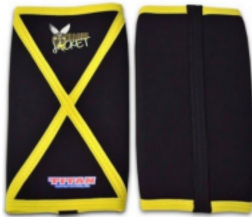
Figura 2. Rodilleras con costura en forma de X. No permitidas en la modalidad RAW Nota: se permiten las rodilleras tipo Titan The Yellow Jacket, pero solo para las divisiones classic, equipado de una capa o equipado de varias capas, no están permitidas en la división raw.

3.8.7. Los atletas no equipados pueden usar rodilleras. No deben llevar velcro y no deben ser ajustables.